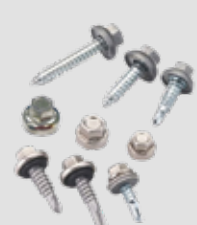
Perno autoperforante (metal - madera)