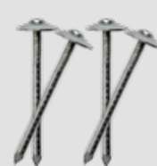
Clavo tipo paraguas