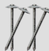
Clavo tipo paraguas