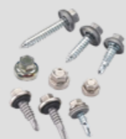
Perno autoperforante (metal - madera)