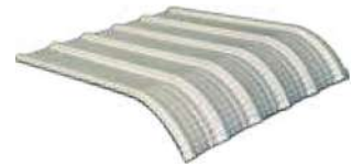
Terminal Curvo e = 0.30mm L = 1400mm