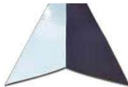
Cumbretero e = 0.30mm L = 3000mm