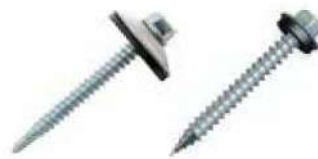
Perno autoperforante (metal – madera)