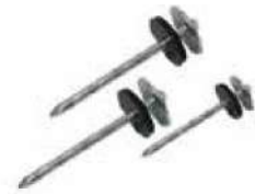
Clavo tipo paraguas